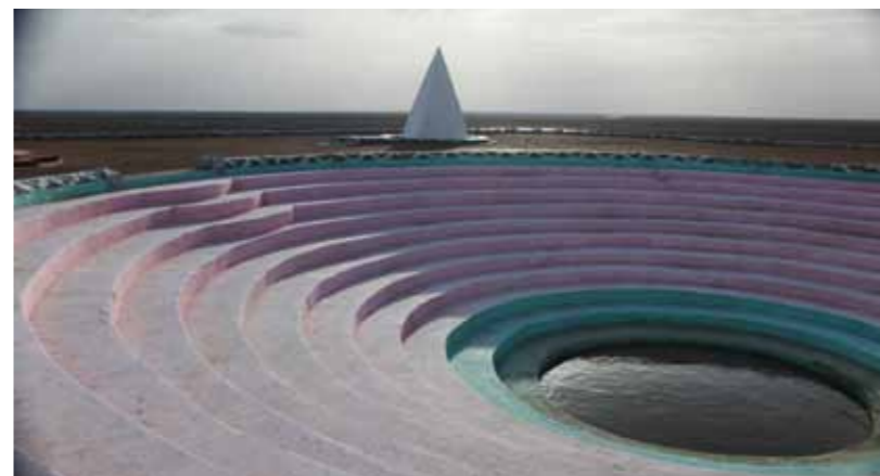
Фото сверху: Байконур. Съёмочная группа в музее космонавтики. Фото снизу: Архитектурный комплекс, посвященный мыслителю, философу, сказителю (VII – X вв.), основоположнику казахской музыки Коркыт-Ата